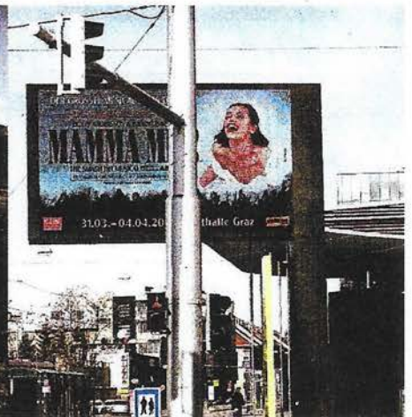
Blick in die Provinz Für die Grazer Messe bloß eine „tolle“ Werbefläche, für zahlreiche Architekten ist die Videowall vor der Stadthalle Symbol für peinliche urbane Fehlgriffe