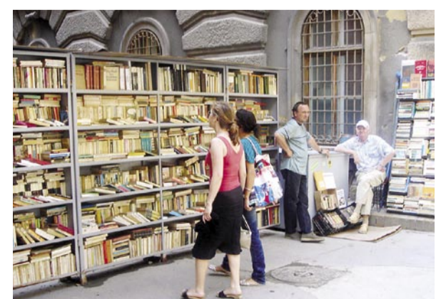
Ein Straßenbuchhändler in Rumänien

über die Plätze Timisoaras für die Delegation der Stadt Graz heuer angemessener gewesen, als eine Stipvisite Flughafen – Rathaus mit peinlichen Gastgeschenken und schlechter Nachrede? Aber wenn Verständnis, Liebe, und ja, Bildung und Wissen zum Thema Stadt und Urbanität nicht vorhanden sind, wird auch Mut zur Gestaltung fehlen. Schon gar, wenn damit partikuläre Interessen enttäuscht werden, und nicht wie im Sinne der herrschenden Konsum-Politik jedem alles recht gemacht wird. Und wer wissen will, was Aneignung des öffentlichen Raumes sein kann, wenn statt lauter Ramsch noch Platz dafür wäre, der möge zu Rumäniens Straßenbuchhändlern flanieren und in warmer Sonne zwischen Groschenroman und Dostojewski stöbern. Das ist ein echtes Erlebnis für Genießer.