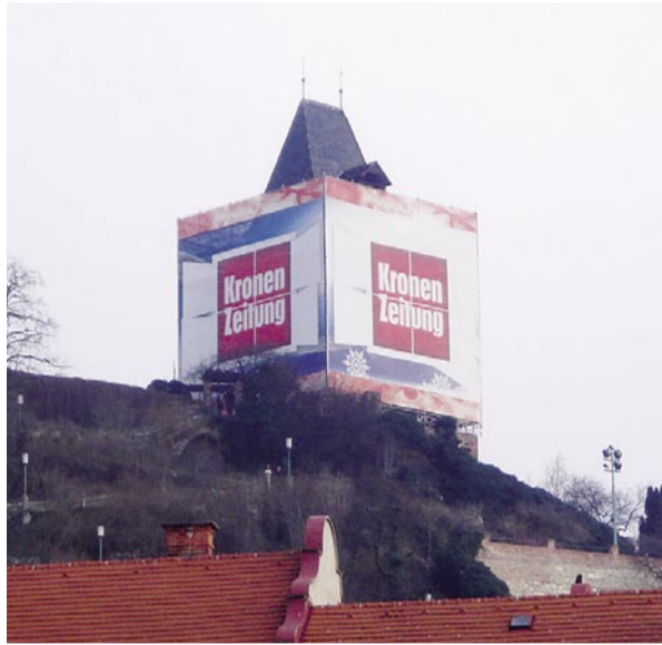
Der Grazer Uhrturm während seiner Renovierung

zu zahlen sein. Und wie sollen Politiker oder Planungsbeamte neue Geschäfte aus dem Hut zaubern, die der Markt nicht generiert? Was haben Bebauungspläne oder Stadtentwicklungskonzepte damit zu tun, ob man in ein Geschäft geht und einkauft oder nicht? Rein gar nichts. Nur eines ist dem allen gemein: Helfen tut das alles nicht viel, von Rostock bis Jennersdorf, von Klagenfurt bis Graz. Ohnmacht macht sich breit, nicht nur bei Innenstadtinitiativen und Stadtmarketinggesellschaften. Außer in einer einzigen dieser Straßen, der Grazer Mariahilferstraße, dort ist kein einziges Geschäft mehr leer. Junge kreative Leute haben neue kleine Geschäfte eröffnet, wo sie produzieren, arbeiten, verkaufen – und Miete zahlen. Die Straße ist von ihrer Leere befreit, weil Neues unternommen wird, was zum kleinen Geschäftsraum und zum Charakter des Stadtraumes passt und umgekehrt. Die wenigen traditionellen Geschäfte passen gut dazwischen. Vielleicht bleibt angesichts wirkungslosen Förderungsrauschens der Interessenvertreter und aller Romantik, die dem Thema der alten Geschäfte der Stadt anhaftet, nur mehr eine Revolution? Freiheit den Erdgeschossen!