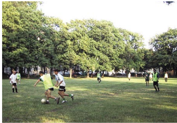
Fussballspiel im Augarten

baner Freiraum getarnte Kosteneinsparung, lassen für die weitere Entwicklung dort das