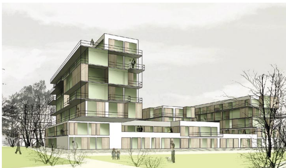
Illustration Wohnbaukomplex SAIKO.CC

Es bleibt die nicht fatalistische sondern berechtigte Hoffnung, dass die aktuelle Krise manches dieser Projekte zum Erliegen und eine Zeit der Konzentration auf das Wesentliche bringt, zumal Graz sich auf die Rückkehr vieler von der grünen Wiese vorbereiten sollte. Für die anstehende Renaissance der Stadt ist mehr erforderlich als die Wiederholung des „Modell Thalia“: Eine Vorstellung, ein Plan und Kompetenzen, um dieses gemeinsame Haus der Stadt zu bauen.