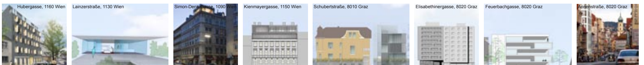
Sanierung, Ausbau, Neubau

Wir forcieren und initiieren bewusst eine städtische Nachverdichtung, welche den Bau und Betrieb der Wohnarchitektur mit Standortfaktoren wie Urbanität und Mobilität zusammen betrachtet. Dies intensiviert die Nutzung vorhandener, ausreichend leistungsfähiger Infrastruktur und stärkt das soziale Gefüge in der Stadt, gerade auch in eher strukturschwachen, innerstädtischen Gegenden. Im Zentralräumen wie Graz oder Wien bestehen dazu beste Voraussetzungen: Es gibt einerseits eine dicht bebaute, städtische Kernzone mit allen urbanen Ausstattungen und Infrastrukturen und andererseits genug Heterogenität durch Lücken, Höhensprünge oder Leerstellen, also „Nischen“, welche bauliche Ergänzungen in dieser Zone zulassen. Last but not least ist die lange erwartete „urbane Renaissance“ eingetreten, sodass nac□